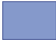
2/1 Seiten, AS