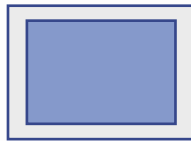
2/1 Seiten, SSP