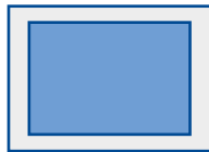
2/1 Seiten, SSP