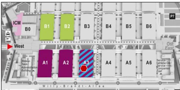
◆ Sonderschau Start-Ups in Halle A3